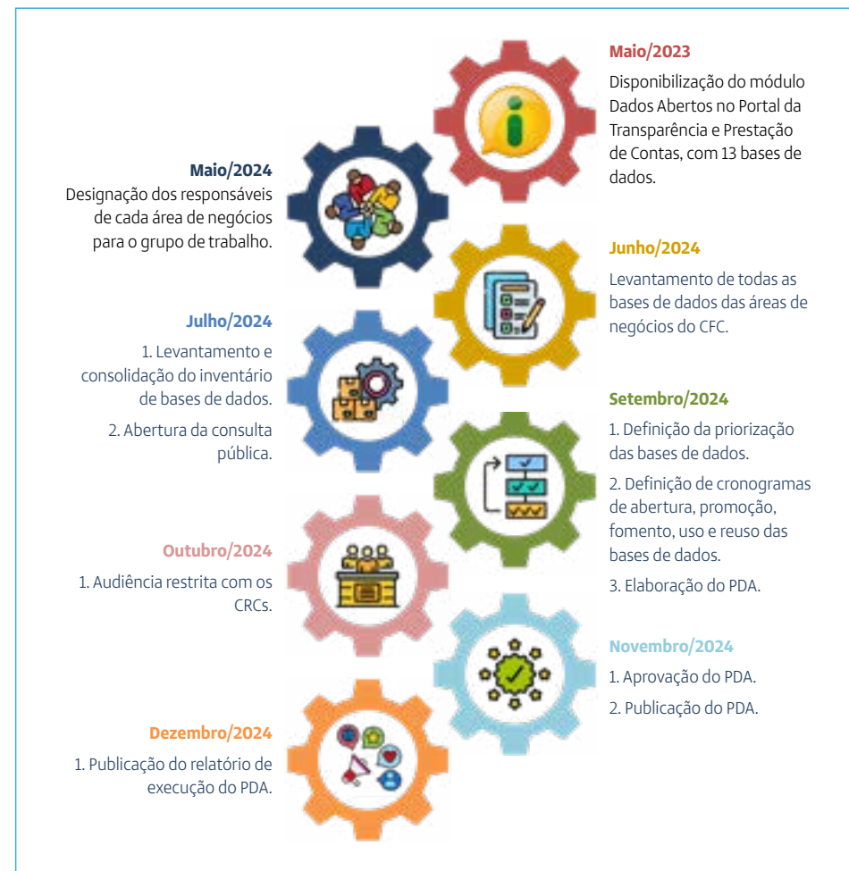
Figura 2 - Etapas para construção do Plano de Dados Abertos do Sistema CFC/CRCs.

7. Publicação do PDA em uma linguagem simples e objetiva.