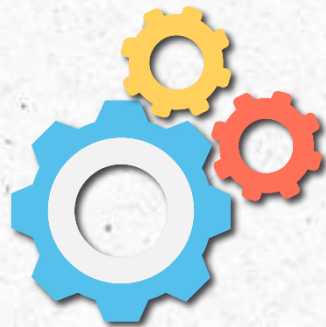
Extração Transformação Carga